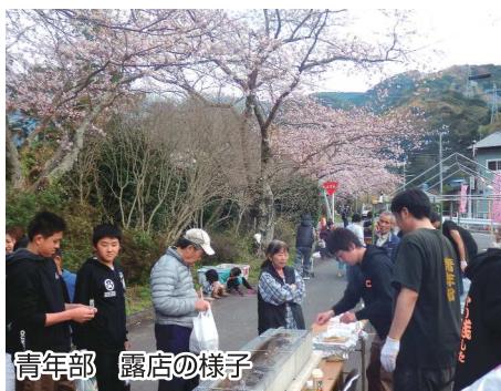
青年部 露店の様子

今年度も青年部は、地元を盛り上げるべく、精力的に活動していきます。皆様のご支援をよろしくお願い申し上げます。