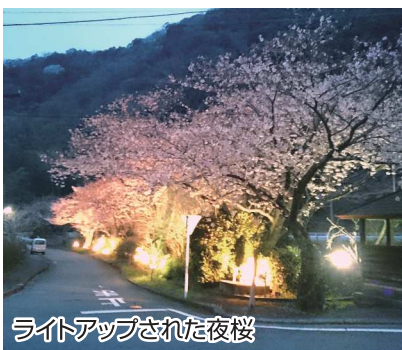
ライトアップされた夜桜

毎年、幻想的な夜桜の下の散歩を楽しみにしている地元の方は多いとのこと。また、旅館にご宿泊のお客様にも夜桜ツアーを楽しんでいただきました。