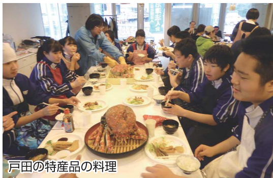
戸田の特産品の料理

時折笑いも交えながらのお話で、中学生の皆さんも夢中で聴いていました。様々な切り口の質問もたくさん飛び出しました。